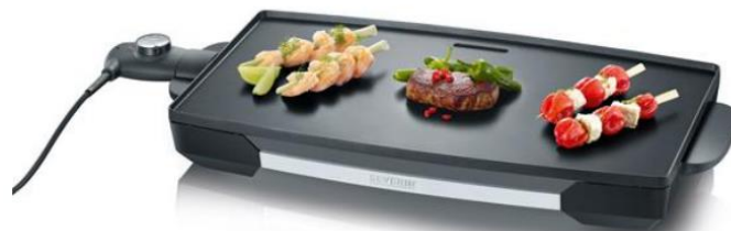
SEVERIN Električni grill stolni, KG2397

Svestran za pečenje mesa, ribe i povrća na roštilju, idealan za japanski "Teppan Yaki". Visokokvalitetna, iznimno velika XXL lijevana ploča s površinom od približno 1933 cm 2 , premazana neljepljivim premazom Odvojivi dovodni vod s podesivim regulatorom temperature i indikatorskim svjetlom